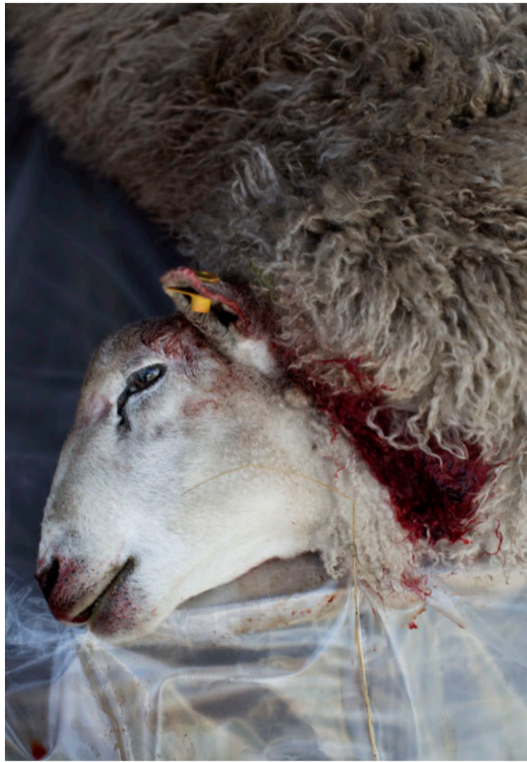
AFLIVNING. Fåret Frederik er lige blevet slagtet – og senere skal han spises.